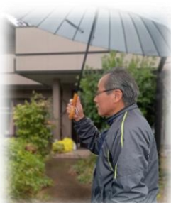
ゴミ出しのため訪問